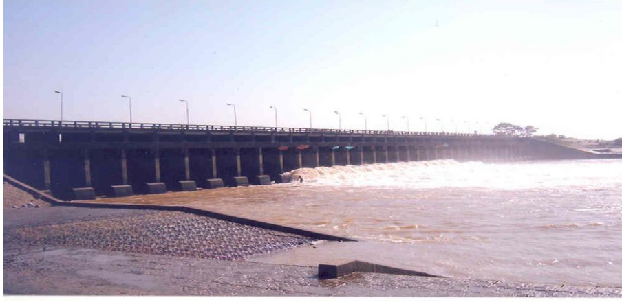
ছবি: বাংলাদেশের দ্বিতীয় বৃহত্তম ফেনীর মুহুরী সেচ প্রকল্প

উক্ত সেচ প্রকল্পটির ফলে ২০,১৯৪ হেক্টর এলাকায় সেচ সুবিধা এবং ২৭,১২৫ হেক্টর এলাকা সম্পূর্ণ সেচ সুবিধার আওতায় আসে। প্রকল্পটির পরিচালনা ও রক্ষণাবেক্ষণের দায়িত্বে রয়েছে বাংলাদেশ পানি উন্নয়ন বোর্ড।