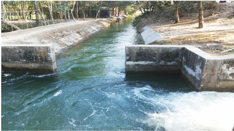
ছবি : Development and Piloting of WMO-Registration & Irrigation Management System শীর্ষক প্রকল্প এলাকা পরিদর্শন