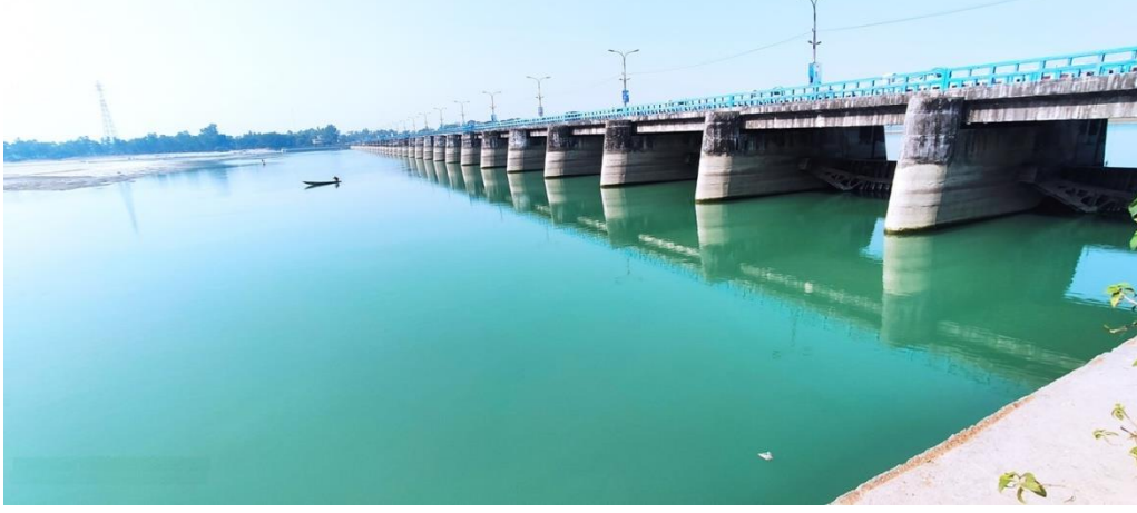
ছবি: বাংলাদেশের সর্ববৃহৎ তিস্তা সেচ প্রকল্প