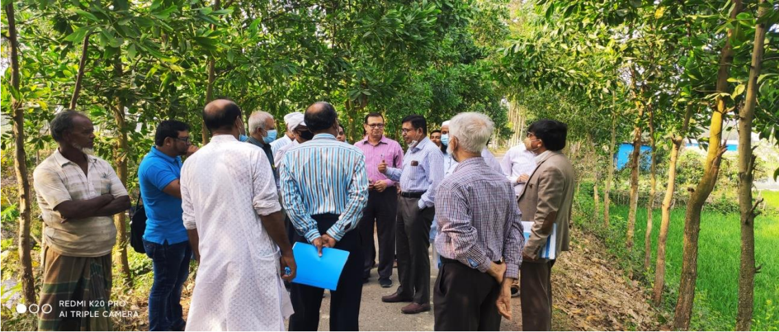
ছবি: Development and Piloting of WMO-Registration & Irrigation Management System' শীর্ষক প্রকল্প এলাকা পরিদর্শন