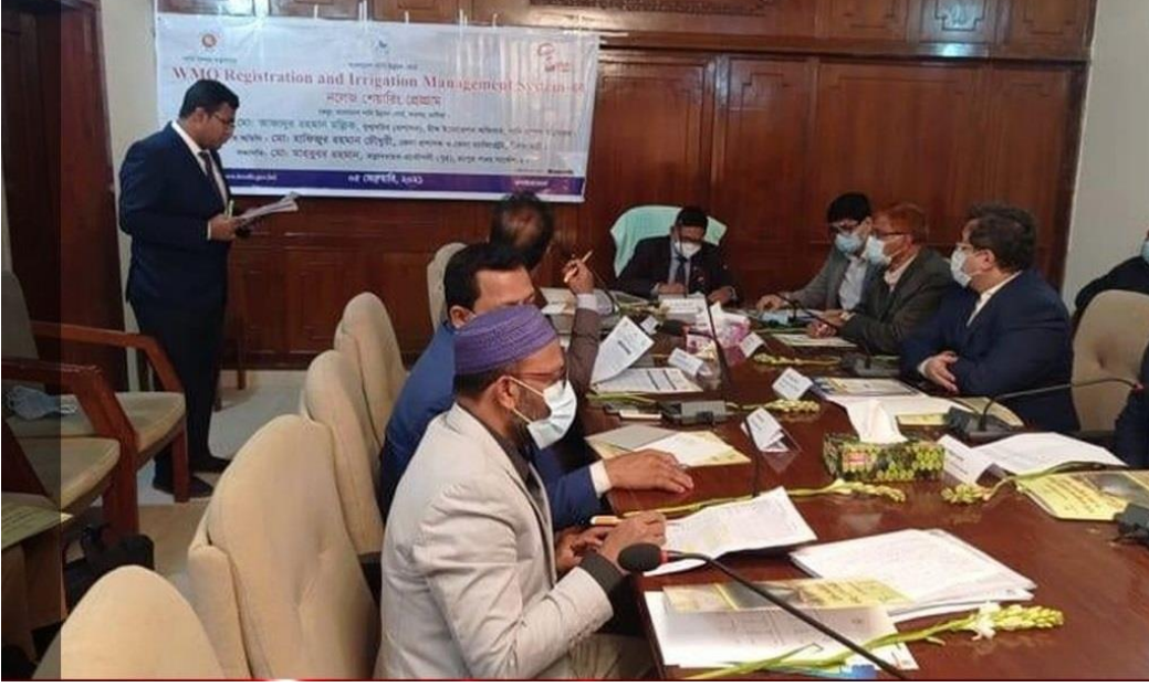
ছবি: ডালিয়ায় অবসর সভাকক্ষে দিনব্যাপী নলেজ শেয়ারিং প্রোগ্রামে উন্মুক্ত আলোচনা পর্ব